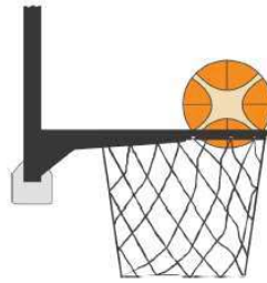
Figura 4 - Palla dentro il canestro

31-24 Precisazione: Se un difensore tocca la palla mentre questa è dentro il canestro, commette una violazione di interferenza.