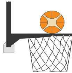
Figura 3 - Palla a contatto con l'anello

31-19 Precisazione: Se un difensore o un attaccante, durante un tiro a canestro su azione, tocca il canestro (anello o retina) o il tabellone, mentre la palla è a contatto con l'anello ed ha ancora la possibilità di entrare nel canestro, commette una violazione di interferenza.