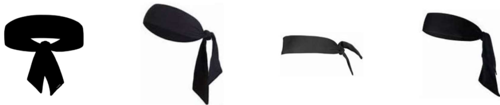
Figura 1 - Esempi di bandane

4-4 Precisazione: Non è consentito indossare bandane.